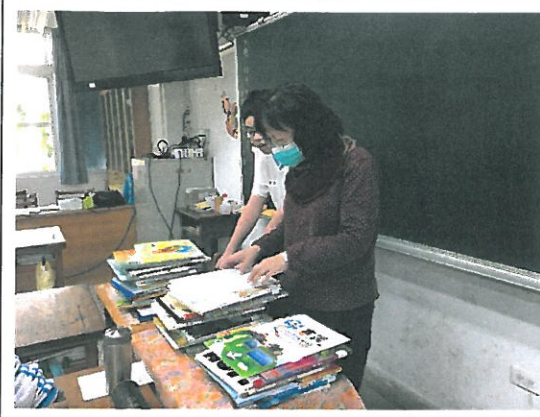
英語老師協助將英語繪本分成難中易