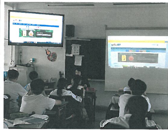
圖書教師介紹英語數位繪本網頁