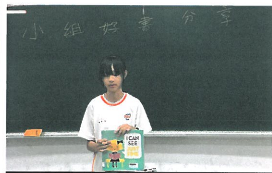
各小組派一人上台錄影分享好書