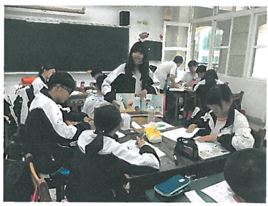
小組內分享英語繪本內容