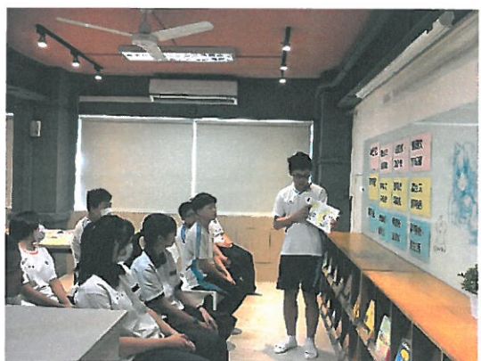
介紹英語繪本給資源班學生