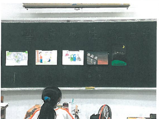
學生作畫及寫出我所學到單字及票選最佳學習單