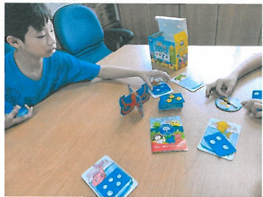
學生課後時間使用教材情形