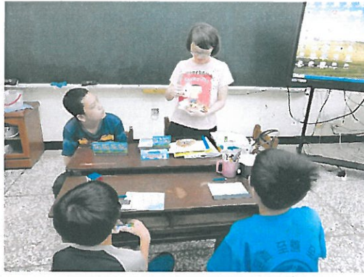
各班英語教師使用情形