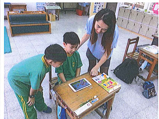
老師善用英聽設備指導學生學習情形