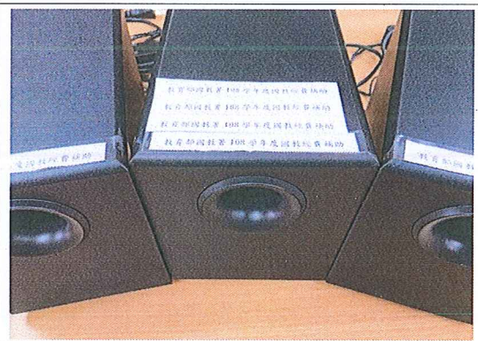
英聽播放行動喇叭