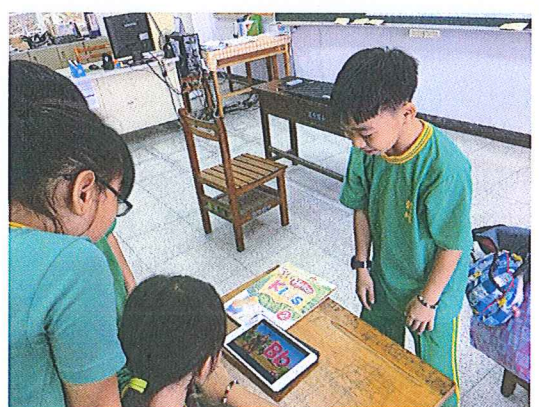
學生自主學習使用情形