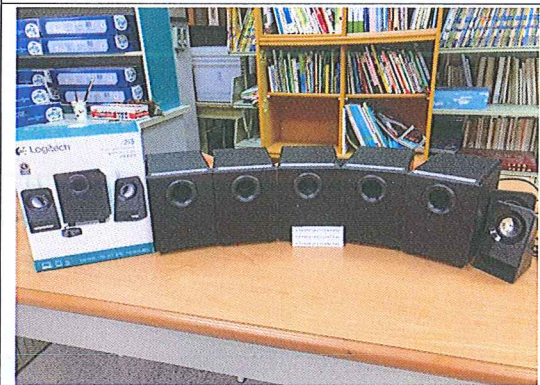
英聽播放行動喇叭