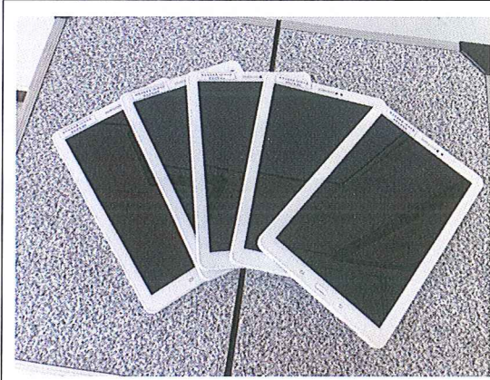
英聽播放行動載具