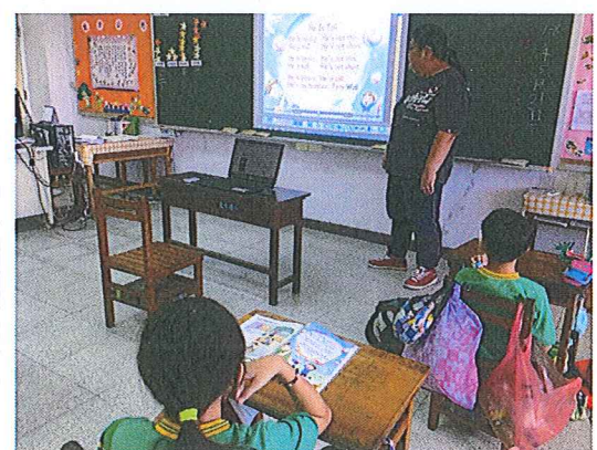
老師善用英聽設備指導學生學習情形