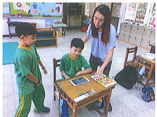
老師善用英聽設備指導學生學習情形