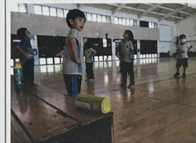
藍芽喇叭播放才藝發表歌舞練習