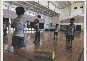
藍芽喇叭播放才藝發表歌舞練習