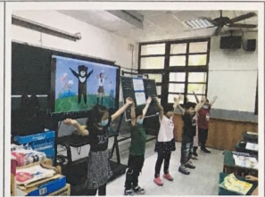
歌謠教學電腦喇叭強化音效音量