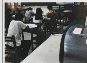
習作習寫時 CD 反覆播放課文