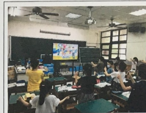
歌謠教學電腦喇叭強化音效音量