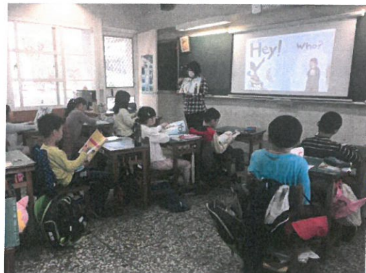
老師帶著孩子一起閱讀繪本。