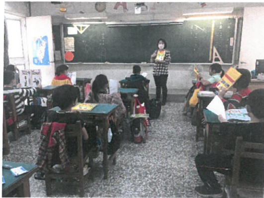
帶孩子先看封面圖片來預測故事內容。