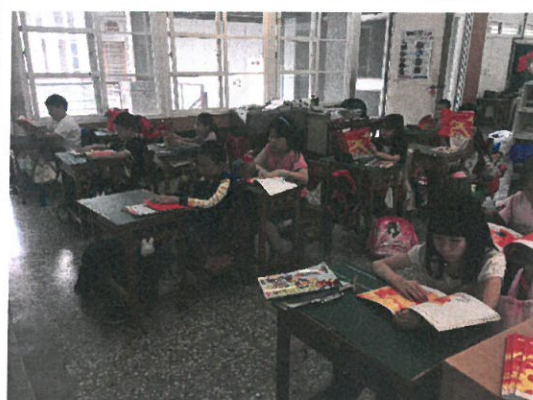
學生自行閱讀繪本。