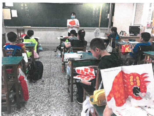
老師帶著孩子一起閱讀繪本。