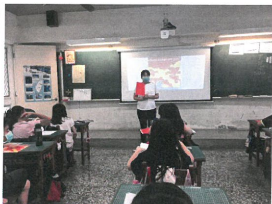
老師帶著孩子一起閱讀繪本。