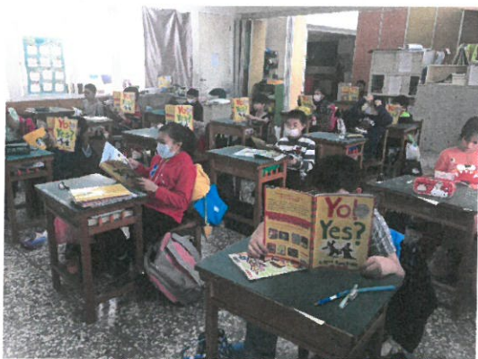
學生自行閱讀繪本。