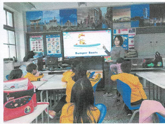
照片說明：讀本影片發音跟讀