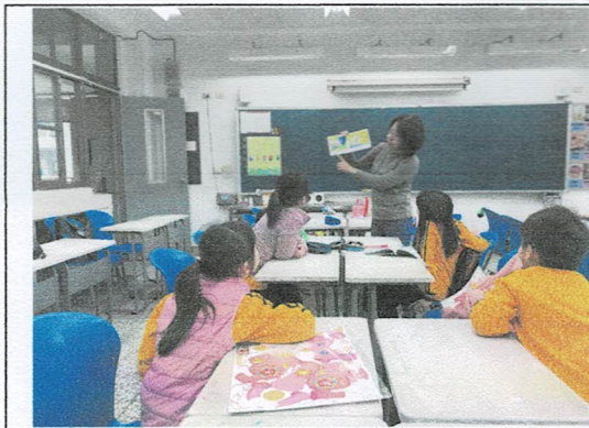
照片說明：應用英語讀本上課