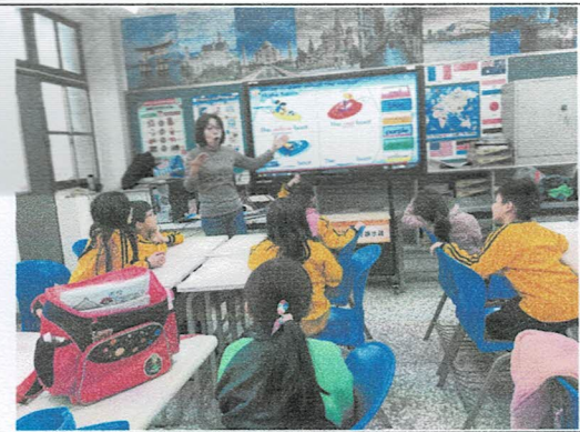
照片說明：搭配繪本影片教學