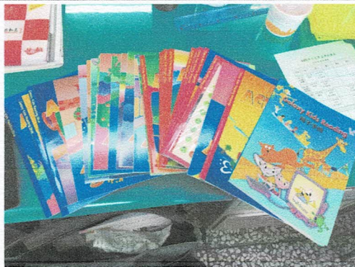
照片說明：英語讀本練習簿