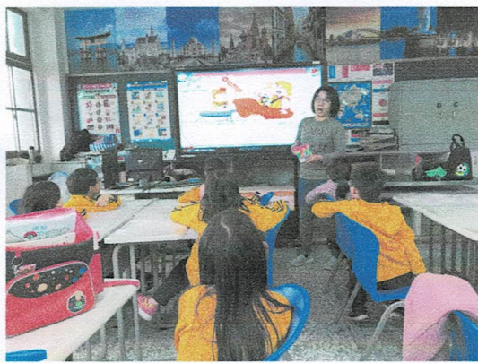
照片說明：運用讀本提升學習廣度