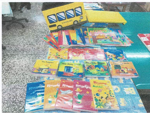
照片說明：購買英語讀本