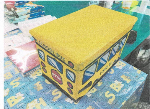
照片說明：讀本專用收納盒