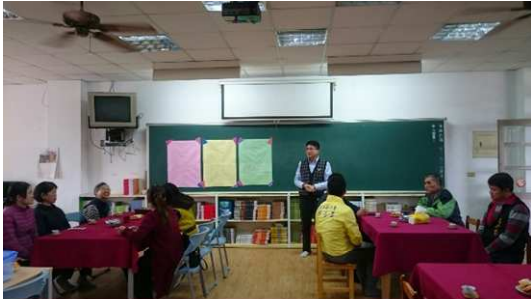
邀請老師布置並說明